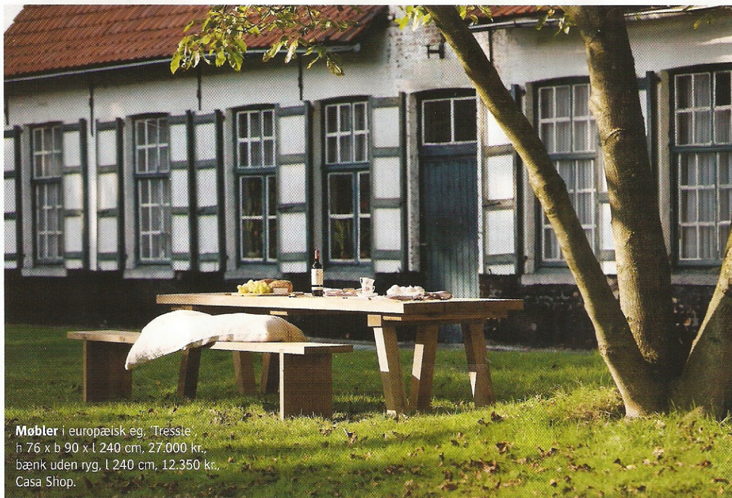
Møbler i europæisk eg, Trestre, h 76 x b 90 x l 240 cm, 27.000 kr., bænke uden ryg, l 240 cm, 12.350 kr., Casa Shop.